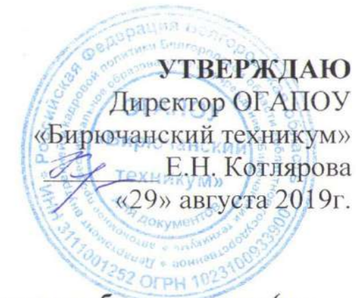
График учебного процесса на 1 полугодие 2019-2020 учебный года Специальность 13.02.11 Техническая эксплуатация и обслуживание электрического и электромеханического оборудования (по отраслям)