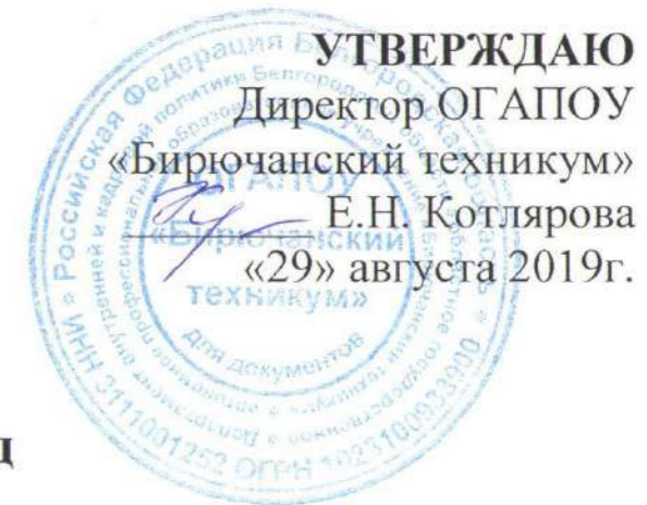
График учебного процесса на 1 полугодие 2019-2020 учебный год

Специальность 35.02.12 Садово-парковое и ландшафтное строительство