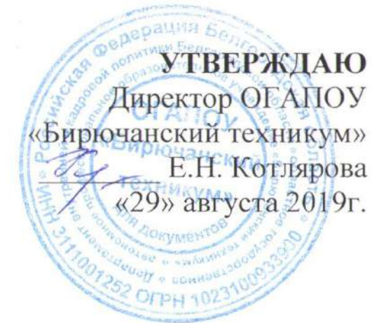
График учебного процесса на 1 полугодие 2019-2020 учебный год